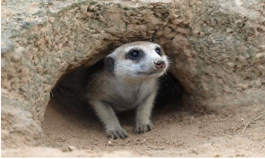
מְחִלָּה (בכתיב מלא: מחילה)

ב. גם המילה חִלּוֹן היא מן השורש _____ . חִלּוֹן הוא למעשה פתח בקיר המפריד בין פְּנִים הבית לחוץ, ואילו מְחִלָּה היא חלל שבעלי חיים שונים חופרים באדמה. לא נתבלבל בין מְחִלָּה מגזרת ע"ע לבין מְחִלָּה מן השורש _____ בגזרת _____, שפירושה סליחה.