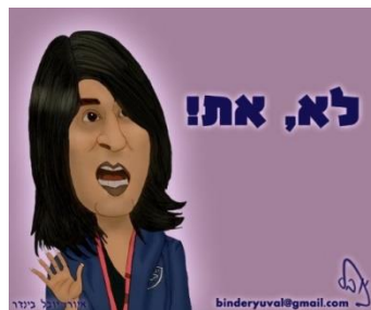
(איור באדיבות יובל בינדר)